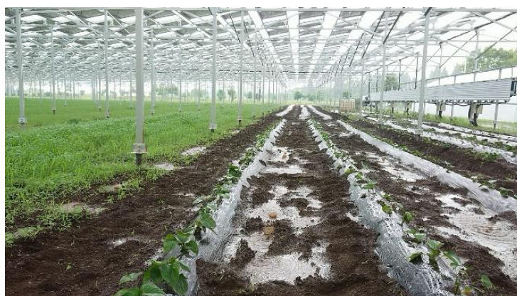
※ソーラーパネル直下に来る水たまり

ソーラーシェアリング設備は通常の太陽光発電設備と比べ、高い位置にソーラーパネルが設置されます。中には4メートルの高さを持つ設備もあり、パネル面に降り注いだまとまった量の雨水が高い位置から落下する（雨垂れ）ことで、作物にダメージを与えたり、泥が跳ねて作物に付着したり、土が削られて根がむき出しになったりする問題が起こっており、これらは作物にとって生育の阻害や病気の原因にもなります。